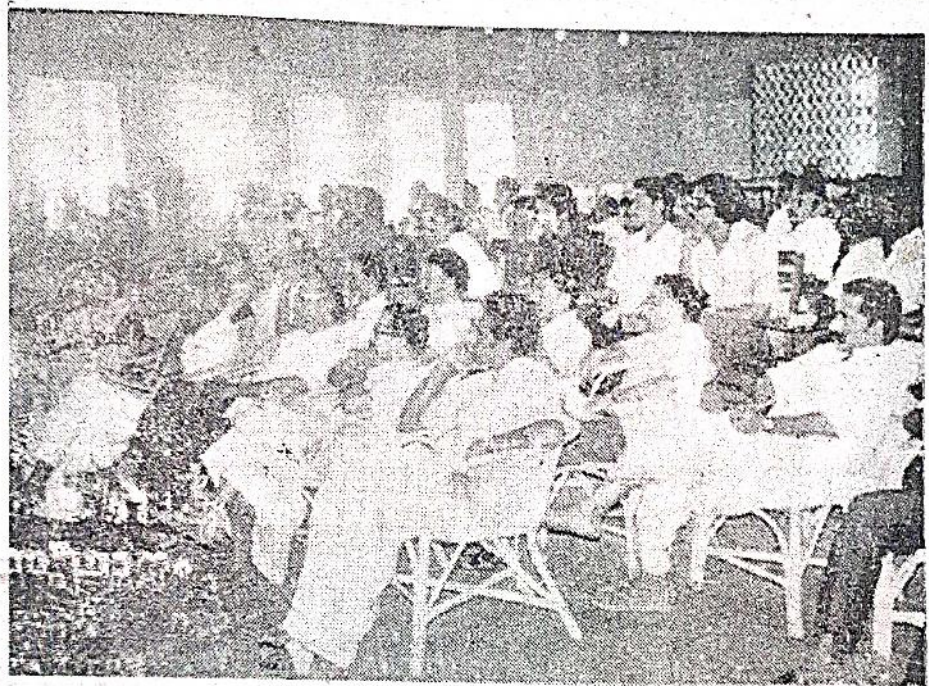
പ്രവർത്തക ക്യാമ്പിൽ പങ്കെടുത്തവർ

വലിയ തുകയ്ക്ക് ഒപ്പിച്ചുകൊടുത്ത് ചെറിയ തുക കൈപ്പറ്റുന്നവരായിരുന്നു അഭ്യോപകരിൽ ഭൂരിഭാഗവും. ഇത്തരം അനീതികൾക്കെതിരെ ആരും ശബ്ദമുയർത്തിയിരുന്നില്ല. മലബാറിൽ രൂപംകൊണ്ട അഭ്യോപക സംഘടന ഇത്തരം പ്രശ്നങ്ങൾ പഠിച്ച് പ്രക്ഷേപണം നടത്തി. സാമ്രാജ്യത്വത്തെ തന്നെ കെട്ടുകെട്ടിയ്ക്കുന്നതിലൂടെ മാത്രമേ വിദ്യാഭ്യാസരംഗത്തെ പ്രശ്നങ്ങളും പരിഹരിയ്ക്കപ്പെടുവാൻ പോകുന്നുള്ളൂ എന്ന ബോധം അഭ്യോപകരിലുണ്ടാക്കാൻ അന്നത്തെ സംഘടനക്കുകഴിഞ്ഞു. സ്വന്തം ആവശ്യങ്ങൾക്കുവേണ്ടി