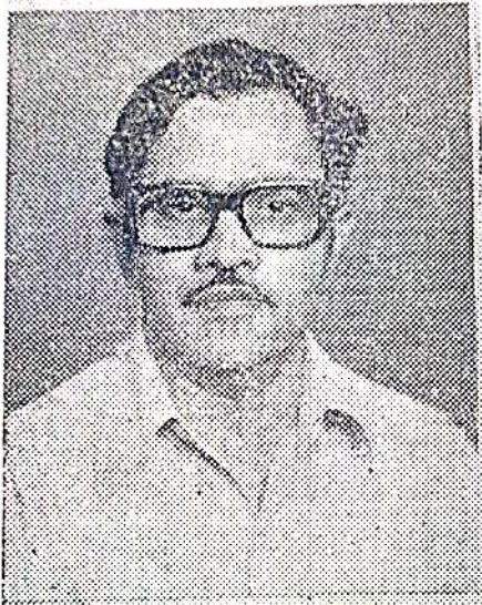
നന്ദിയോട് രാമചന്ദ്രൻ വൈസ് പ്രസിഡൻ്റ്