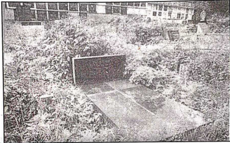
തെമ്മാടിക്കുഴിയിൽ എം.പി.പോൾ അന്ത്യവിശ്രമം കൊള്ളുന്നു

പ്രൈവറ്റ് കോളജധ്യാപകരുടെ അന്നത്തെ അവസ്ഥ മനസ്സിലാക്കാൻ സെന്റ് തോമസ് കോളജിലേക്ക് നോക്കിയാൽ മതി. പ്രൊഫ.ജോസഫ് മുണ്ടശ്ശേരി എഴുതുന്നു. "വച്ചുപൊറുപ്പിക്കാൻ വയ്യാത്ത ഏതാനും നടപടികളുണ്ടായിരുന്നു മാനേജ്മെന്റിന്റെ ഭാഗത്ത്. പലർക്കും കണിശമായി ഗ്രേഡ് നിശ്ചയിച്ച് നിയമനോത്തരവ് നൽകിയിരുന്നില്ല. പുതിയ കൊല്ലം ആരംഭിക്കുമ്പോൾ ഇംക്രിമെന്റ് കിട്ടിയാൽ കിട്ടി എന്നമട്ടായിരുന്നു. അതൊക്കെയിരിക്കട്ടെ. തരാൻ നിശ്ചയിച്ചിരുന്ന ശമ്പളം തന്നിരുന്നതുതന്നെ മാസത്തിൽ പലതവണയായിട്ടാണ്. മാസാന്തം ഇന്ന തീയതിക്ക് കണക്കുവസാനിപ്പിക്കുക എന്ന പതിവില്ലായിരുന്നു. അങ്ങനെ ഓരോരുത്തനും ഗതികേടിന്റെ പേരിൽ ഇടയ്ക്കിടയ്ക്ക് കുറേശ്ശേപ്പറി കുറേമാസ്സുകളങ്ങോട്ടു പോകുമ്പോൾ ഹെഡ്ക്വാർട്ടർക്കിന്റെ കണക്കിൽ ചിലർക്ക് അധികപ്പറുണ്ടാവും; ചിലർക്ക് നേരെ മറിച്ചും. കുത്തിക്കുറിച്ചു കണക്കുപിടിക്കലേ ഉണ്ടായിരുന്നുള്ളൂ ഹെഡ് ക്വാർട്ടർക്ക്. ആ കണക്കിലെ ശരിയും തെറ്റും ഹെഡ്ക്വാർട്ടർക്കിന്റെ തന്റേടത്തിൽ ഒതുങ്ങിക്കിടക്കുകയായിരുന്നു. പ്രിൻസിപ്പാളിന്റെ വിശ്വസ്ത സേവകനായിരുന്ന ആ ഹെഡ്ക്വാർട്ടർക്കിന്റെ രക്ഷാധികാരത്തിന്മേൽ മുഖം കറുപ്പിച്ചവർക്ക് തക്കസമയത്തു പണം കിട്ടാൻ പ്രയാസമായിരുന്നു. ഇത് നാണം കെട്ട ഒരു ഏർപ്പാടായി എന്ന് പോളിനൂതോന്നി. അദ്ദേഹം ഒരു ദിവസം പ്രിൻസിപ്പാളിനും വെട്ടിക്കണ്ടിച്ചൊരു കത്തെഴുതി - മാസംതോറും ശമ്പളം തീർക്കുന്നത് ഇന്ന തീയതിക്കാണ് കണിശപ്പെടുത്തി കിട്ടണമെന്നു നിർബന്ധിച്ചുകൊണ്ട്. നിശ്ചയിക്കുന്ന തീയതി നാൽപ്പതാം തീയതി ആയാലും അന്നെല്ലാവർക്കും ശമ്പളം കിട്ടാൻ കഴിയണം എന്നായിരുന്നു പോളിന്റെ വാദം. ഇതൊരു നിസ്സാര സംഭവമായി തോന്നാം. പരമാർത്ഥത്തിൽ സെന്റ്