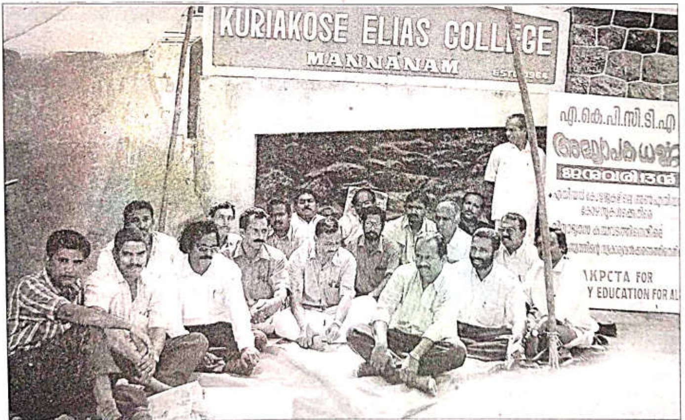
മാന്നാനം കെ. ഇ. കോളജിന് മുന്നിൽ നടന്ന ധർമ്മ