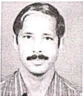
P. Gopinathan Sree Krishna College Guruvayoor