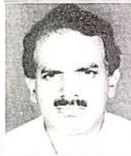
M. Saffarudeen MES College, Mannarcaud