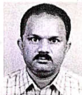
C.T. Francis St Joseph's College Devagiri