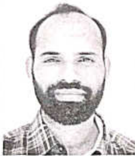
Dr.D.K. Babu Guruvayoorappan College Kozhikode