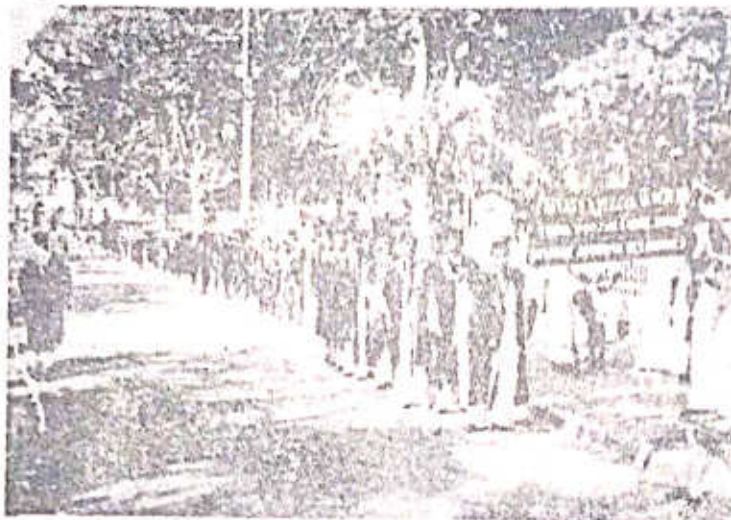
തുല്യജോലിക്ക് തുല്യവേതനം ആവശ്യപ്പെട്ടുകൊണ്ട് 1961ൽ എ.കെ.പി.സി.ടി.എയുടെ നേതൃത്വത്തിൽ തിരുവനന്തപുരത്ത് നടത്തിയ പ്രകടനം

വൻ കോളജ് അധ്യാപകർക്ക് ഏറെ ആശ്വാസം പകരുന്നതായിരുന്നു ഈ തീരുമാനം. വിമോചനസമരത്തിന്റെ ആസൂത്രകരും സാമ്രാജ്യത്വ ശക്തികളും ഇ. എം. എസ് സർക്കാരിനെ അധികാരത്തിൽ നിന്ന് പുറത്താക്കുന്നതിൽ വിജയിച്ചു. എങ്കിലും വരാനുള്ള കാലഘട്ടത്തിൽ ഊർജ്ജിതമായ സംഘടനാ പ്രവർത്തനം നടത്തുന്നതിന് എ കെ പി സി ടി എ പോലുള്ള അധ്യാപക സംഘടനകൾക്ക് ശക്തി പകർന്നത് 1957 ൽ അധികാരമേറ്റ ഇ എം എസ് സർക്കാരിനായിരുന്നു. വിമോചന സമരത്തെ അവഗണിച്ചുകൊണ്ട് 'വിദ്യാഭ്യാസബിൽ സിന്റാബാദ്' എന്ന് ശബ്ദത്തോടെയും നിശബ്ദമായും ഏറ്റുവിളിക്കാൻ പ്രൈവറ്റ് കോളജ് അധ്യാപകരും സജ്ജരായി.