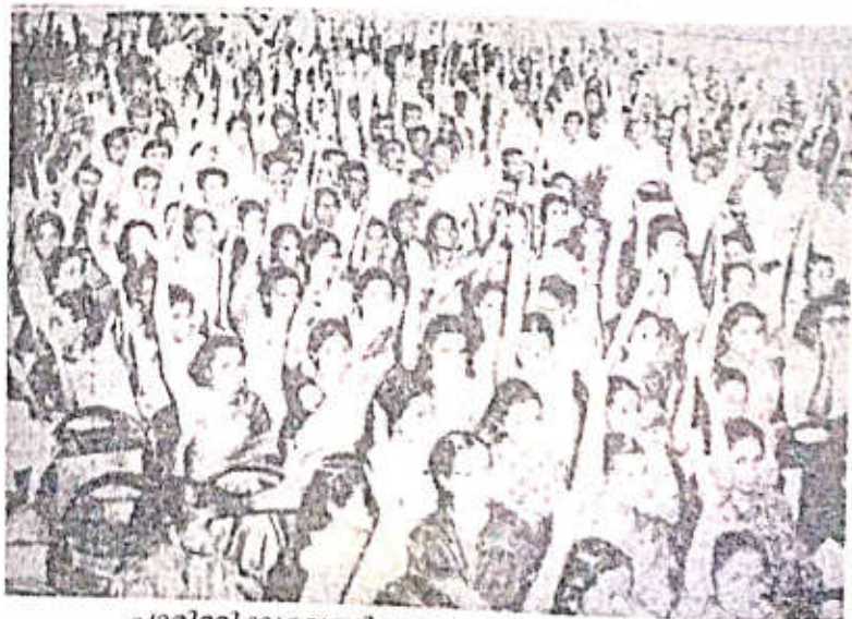
പാരിറിനിക്കുവേണ്ടിയുള്ള സമരത്തിന് അനുകൂലമായി കോട്ടയം കൺവെൻഷനിൽ പ്രതിനിധികൾ വോട്ടുചെയ്യുന്നു.